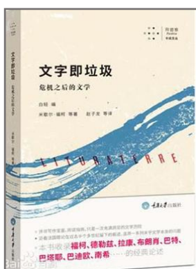
《文字即垃圾：危机之后的文学》 米歇尔·福柯 I06/145

该书以实践本体论为理论内核，以互动过程为理论视角，以辩证法为理论方法，在“参与实践”、“身份承认”和“秩序变革”之间建立起一个因果作用机制，其目标是为中国参与国际体系提供不同于现有国际关系理论的新理论解释框架，分析解释中国在国际经济、政治安全、社会文化体系中的参与过程、程度、动力与发展趋势，在总结经验教训的基础上为中国今后参与国际体系建设提供战略预测和政策建议。